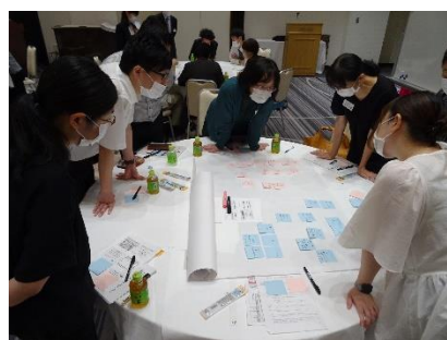
写真(上):ワークショップの様子、 写真(下):記念祝賀会の様子