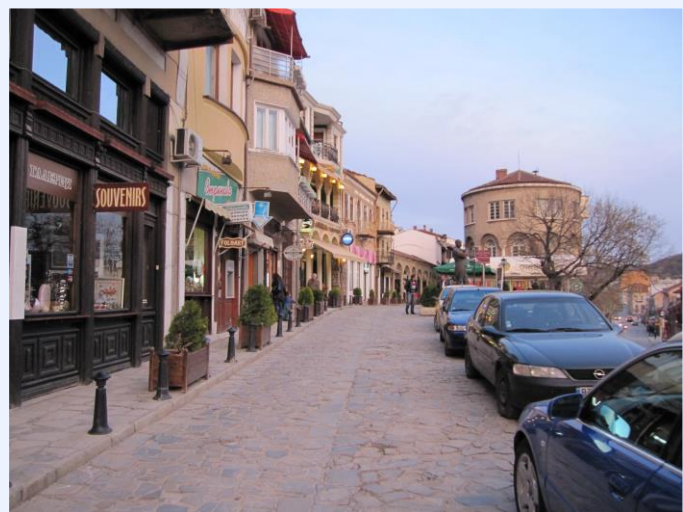
プレーベンの街並み

プレーベンはブルガリアの北部にあり、国内では3番目に大きい北ブルガリア都市として知られています。