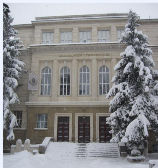
プレーベン医科大学

海外医学部には本コースの1年生に入る(入学して勉強を始める)前に予備コースが用意されていて、生物、物理、化学といった科目に自信のない方や英語や現地の言語に慣れておきたい方が対象です。日本の大学受験予備校に1年間通学するようなものです。授業料は本コース学費の半額程度ですみます。海外の医学部には日本の国公立大学の医学部より授業料が安く卒業できる大学も多くあります。経済面で進学を諦めている学生にも選択肢の一つになるのではないのでしょうか。